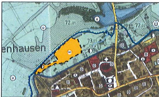
Auszug aus dem Flächennutzungs- und Landschaftsplan, Änderung durch Deckblatt Nr. 7