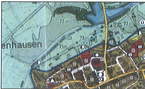
Auszug aus dem Flächennutzungs- und Landschaftsplan, Stand 1990