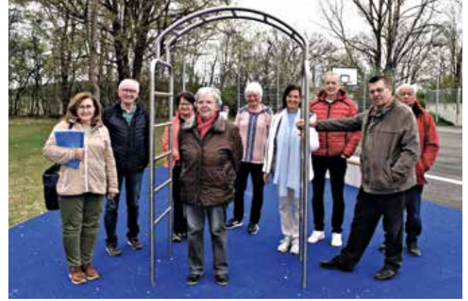
Links: In den Kochkursen für den kleinen Haushalt werden auch Informationen zur gesunden Ernährung vermittelt. Rechts: Kennenlernen der Geräte am Bewegungsparcours im Sportpark an der Vilsaue.