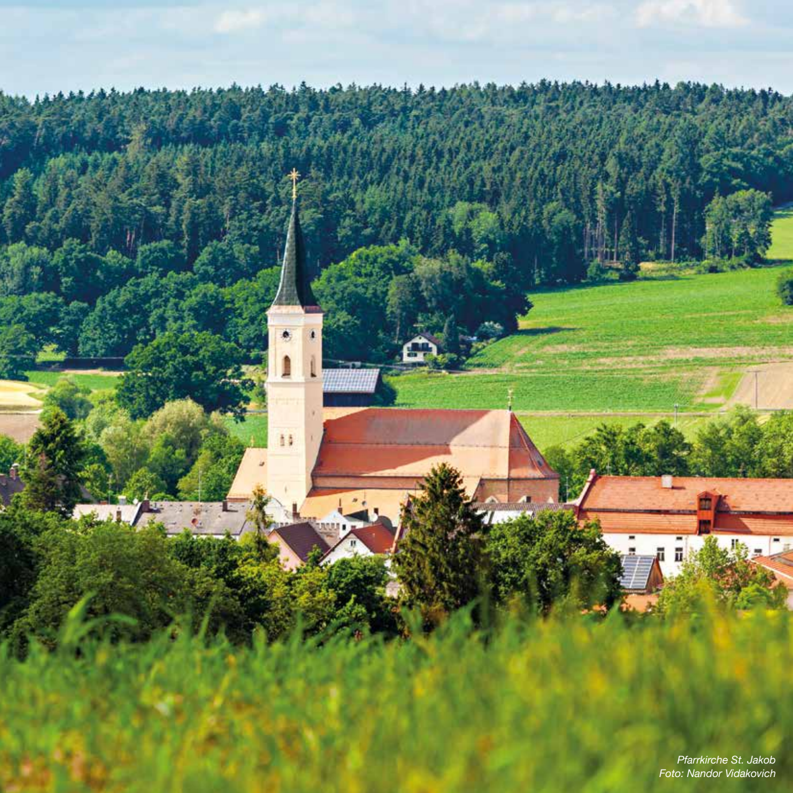
Pfarrkirche St. Jakob