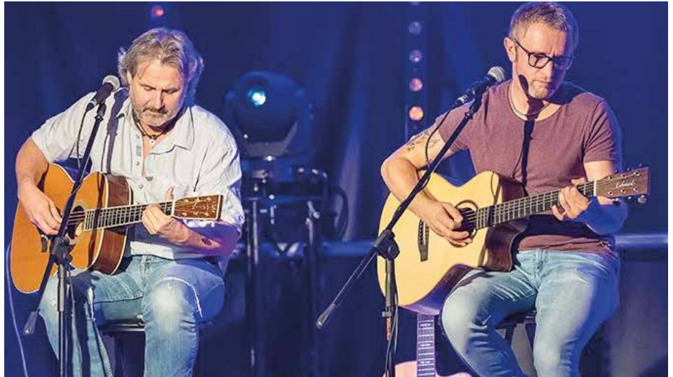
21.03.25 GRACELAND – „Tribute to Simon & Garfunkel“