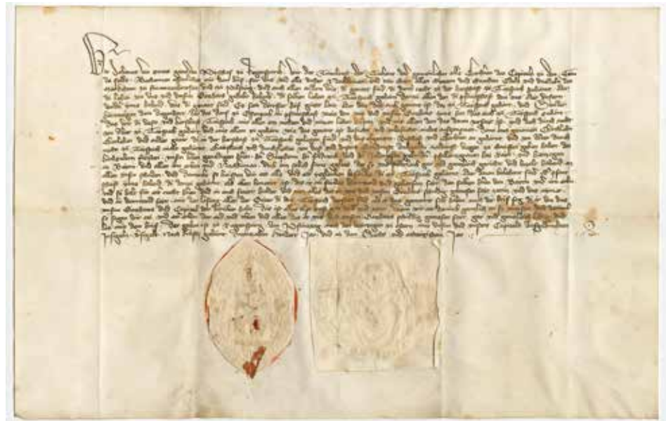
Verkaufsurkunde des Bischofs Johannes I. von Regensburg vom 26. April 1386 (Hauptstaatsarchiv München, Kurbaiern 21270). Ausfertigung der Urkunde in Pergament mit zwei gedruckten Siegeln, Höhe 26,5 cm und Breite 41 cm. Vermerk auf der Rückseite: „Kaufbrief uver Teispach (15. Jahrhundert)“.

Weitere Erläuterungen und Lichtbilder dazu unter: www.marktfrontenhausen.de/die-urkunden-des-marktes-frontenhausen